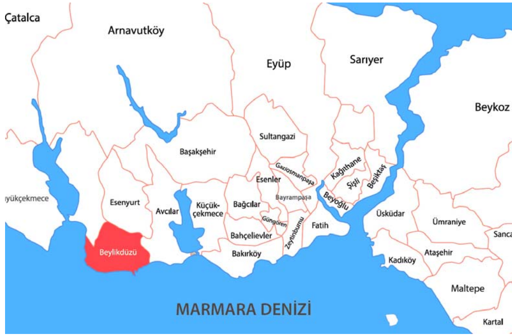
Harita 2. 2015 yılında Beylikdüzü ilçesinin İstanbul'daki konumu.

2008 yılında çıkarılan 5747 Sayılı Kanun ile İstanbul'daki belediye bölümlenmesi yeniden düzenlendi. Küçük belediyeleri ortadan kaldırıp kurumsal kapasitesi ve mali imkânları daha güçlü belediyeler oluşturmayı amaçlayan kanun değişikliği ile İstanbul'daki ilk kademe belediyeler kaldırıldı. Bu belediyelerin bazıları mahalle olarak bir ilçeye katılırken bazıları birleşerek ya da mevcut bir ilçeden yeni mahallelerin de katılımı ile yeni bir ilçe oldu.